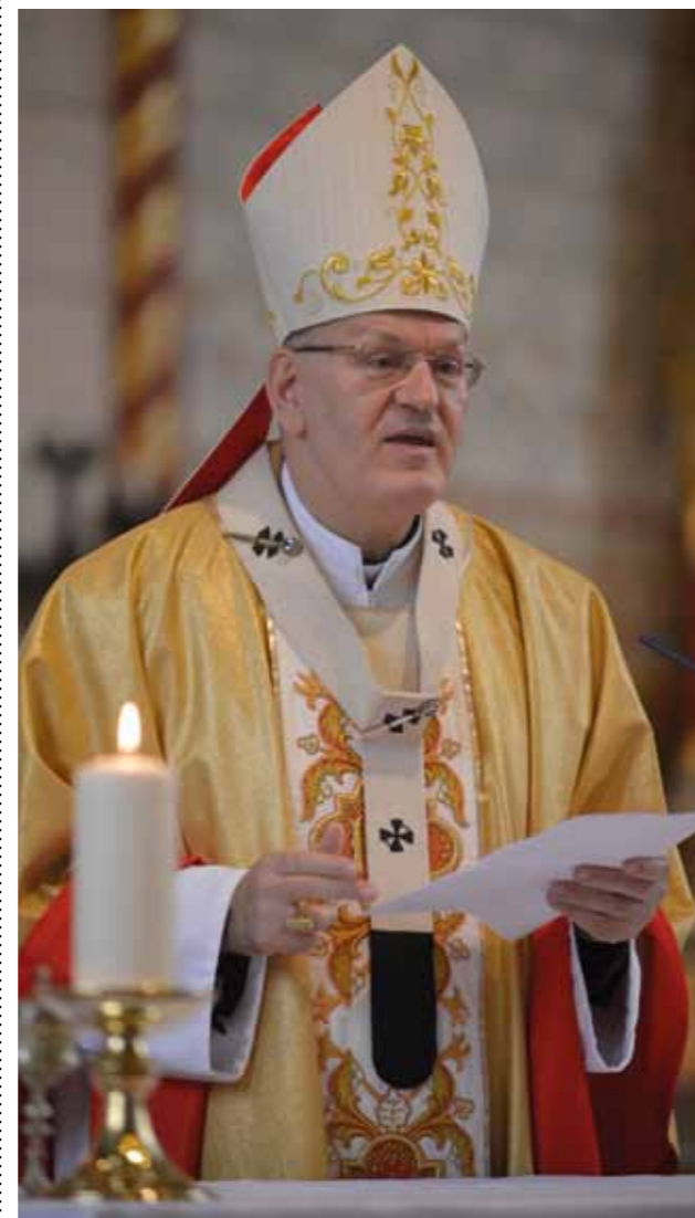
A bíboros szentmiséje a Rózsák terei Szent Erzsébet plébániatemplomban

Erdő Péter (Budapest, 1952. június 25.) bíboros, teológus, kánonjogász, egyetemi tanár, a Magyar Tudományos Akadémiarendes tagja. 1998 és 2003 között a Pázmány Péter Katolikus Egyetem rektora. 2002-től az Esztergom-Budapesti főegyházmegeye érseke. 2003-tól Magyarország prímása, majd 2003.szeptember 28-án vált a pápaválasztó bíborosi testület tagjává. 2005-től a Magyar Katolikus Püspöki Konferencia és az Európai Püspöki Konferenciák Tanácsának (CCEE) elnöke.