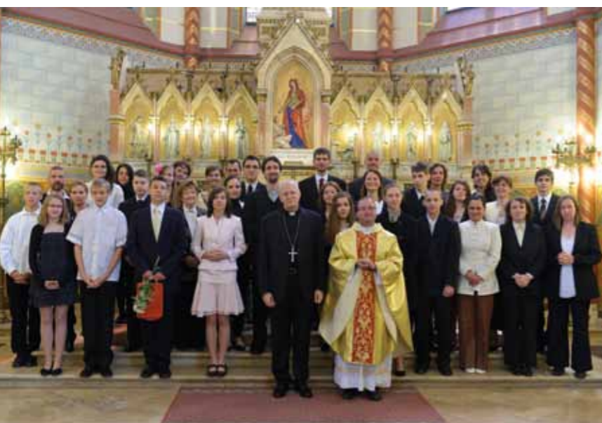
Bérmálkozók a Szentháromság vasárnapján

Erdő Péter (Budapest, 1952. június 25.) bíboros, teológus, kánonjogász, egyetemi tanár, a Magyar Tudományos Akadémiarendes tagja. 1998 és 2003 között a Pázmány Péter Katolikus Egyetem rektora. 2002-től az Esztergom-Budapesti főegyházmegeye érseke. 2003-tól Magyarország prímása, majd 2003.szeptember 28-án vált a pápaválasztó bíborosi testület tagjává. 2005-től a Magyar Katolikus Püspöki Konferencia és az Európai Püspöki Konferenciák Tanácsának (CCEE) elnöke.